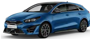
Modrá Flame (B3L)