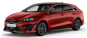
Červená Infra (AA9)