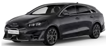
Šedá Penta Metal (H8G)