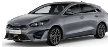
Stříbrná Lunar (CSS)