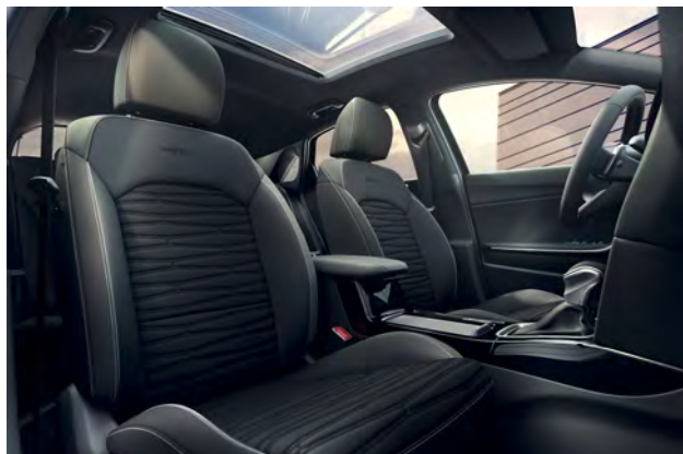
Čalounění v kombinaci látka/umělá kůže standard pro GT-Line Plus