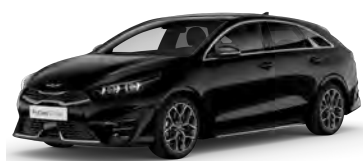
Perlet'ová Černá (1K)