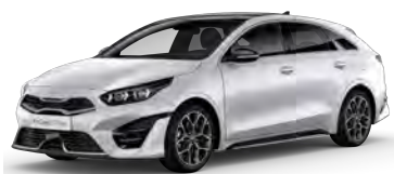
Perlet'ová Bílá Deluxe (HW2)