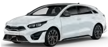
Bílá Cassa (WD)