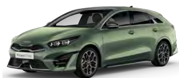
Zelená Experience (EXG)