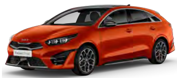
Oranžová Fusion (RNG)