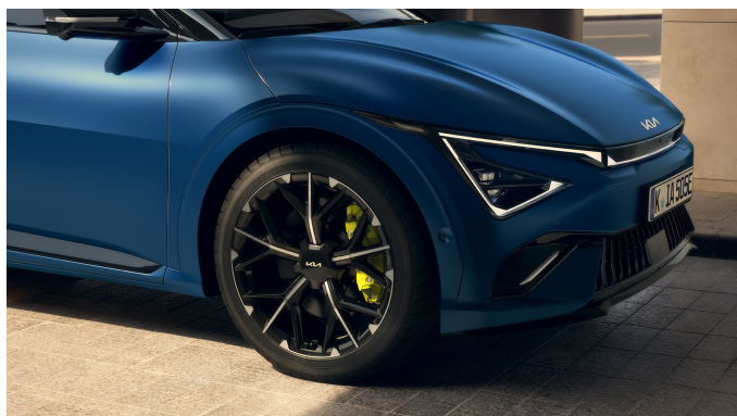
21" slitinový disk GT s pneumatikami 255/40 R21