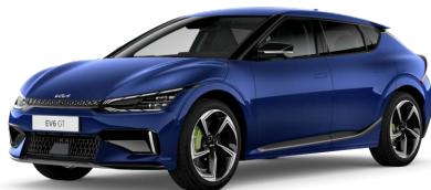
Modrá Yacht (DU3)