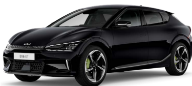
Perleťová Černá Aurora (ABP)