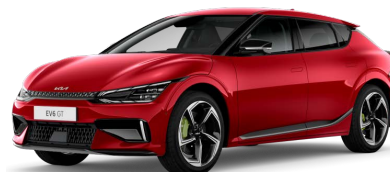
Červená Runway (CR5)