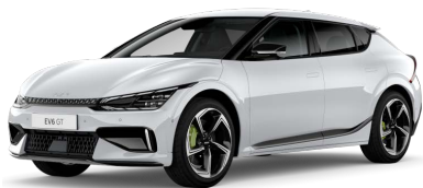
Perleťová Bílá Snow (SWP)