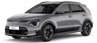
Šedá Steel (KLG)