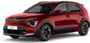
Červená Runway (CR5)