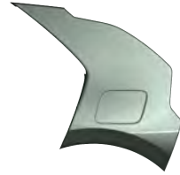
Zelená Cityscape (CGE)