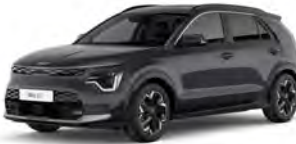
Šedá Interstellar (AGT)