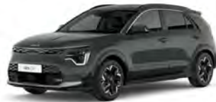
Zelená Cityscape (CGE)