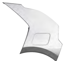
Šedá Interstellar (AGT)