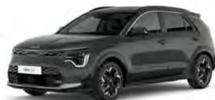
Zelená Cityscape (CGE)