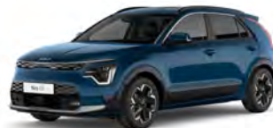
Modrá Mineral (M4B)