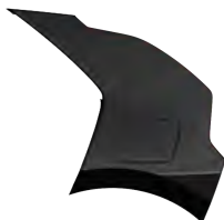
Perleťová Černá Aurora (ABP)