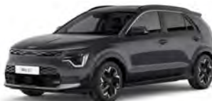
Šedá Interstellar (AGT)