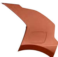
Oranžová Delight (DRG)