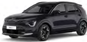
Perleťová Černá Aurora (ABP)