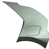
Zelená Cityscape (CGE)