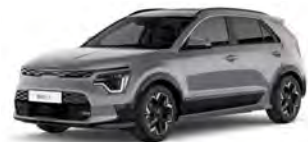
Šedá Steel (KLG)