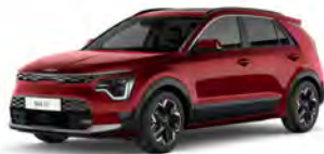
Červená Runway (CR5)