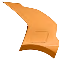
Oranžová Tangerine (TGT)