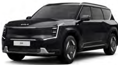
Perleťová Černá Aurora (ABP)