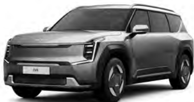
Šedá Pebble (DFG)