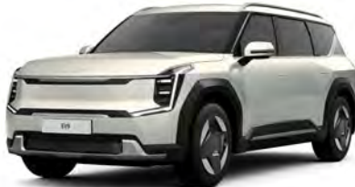
Stříbrná Ivory - matná (ISM) - nedostupné pro GT-Line