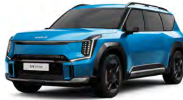
Modrá Ocean - lesklá (OBG) - dostupné pouze pro GT-Line