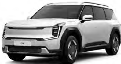
Perleťová Bílá Snow (SWP)