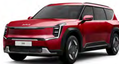
Červená Flare (C7R)