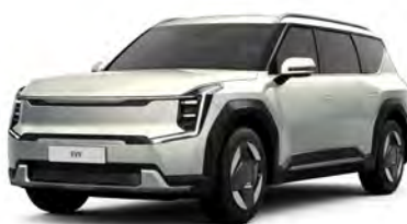
Stříbrná Ivory - lesklá (ISG) - nedostupné pro GT-Line