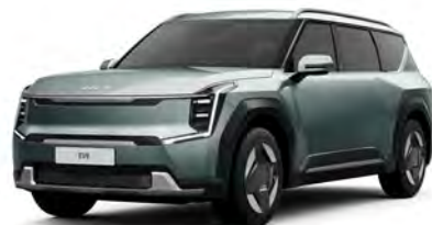
Zelená Iceberg (IEG)