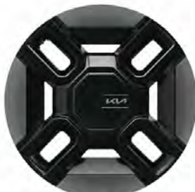
21" hliníkové disky kol s pneumatikami 285/45 R21

Ceny jsou uváděny v Kč včetně DPH. K ceně mohou být účtovány náklady na převoz vozidla na prodejní místo. Kia Czech s.r.o. si vyhrazuje právo měnit ceny a specifikace výbav modelů bez předchozího upozornění. Uvedená data jsou informativní a nejsou závazná pro uzavření kupní smlouvy, jedná se o doporučené prodejní ceny. Slevy a bonusy jsou určeny pro individuální zákazníky spotřebitele na nákup jednoho vozu. Podmínky pro firmu a podnikatele žádejte u autorizovaných dealerů Kia. Všechna vozidla jsou schválena pro provoz na pozemních komunikacích v ČR a splňují emisní limity odpovídající normě EURO 6. Služba Apple CarPlay není v ČR oficiálně podporována a její funkčnost může být omezená. Funkčnost služby Android Auto je závislá na druhu mobilního zařízení. Záruka Kia platí po dobu 7 let od první registrace vozidla, nebo do ujetí 150 000 km, první 3 roky bez omezení kilometrů. Kompletní podmínky záruky Kia naleznete na https://www.kia.com/cz/prodej/7-leta-zaruka/