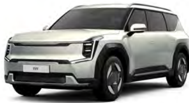
Stříbrná Ivory - lesklá (ISG)