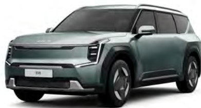
Zelená Iceberg (IEG)