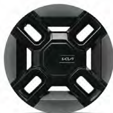
21" hliníkové disky kol s pneumatikami 285/45 R21