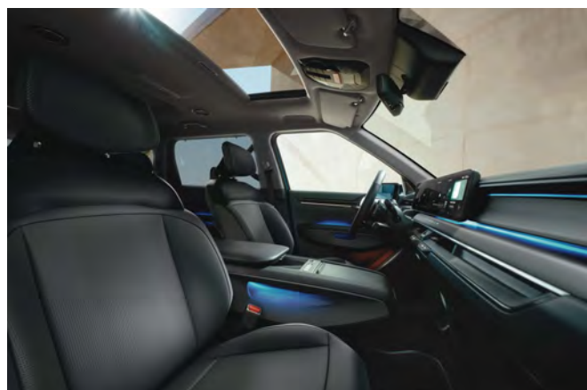
Tmavý interiér (veganská kůže) - standardně pro Earth