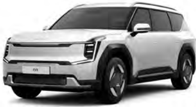
Perletová Bílá Snow (SWP)