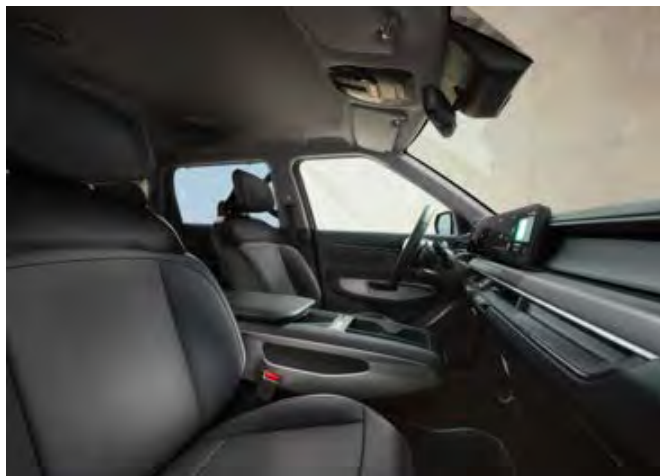
Tmavý interiér (veganská kůže) - standardně pro Air