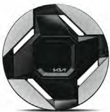
19" hliníkové disky kol s pneumatikami 255/60 R19