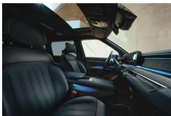
Modrý interiér (veganská kůže) - volitelně pro GT-Line