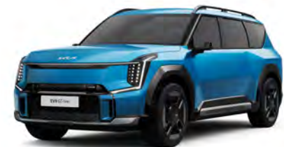
Modrá Ocean - matná (OBM) - dostupné pouze pro GT-Line