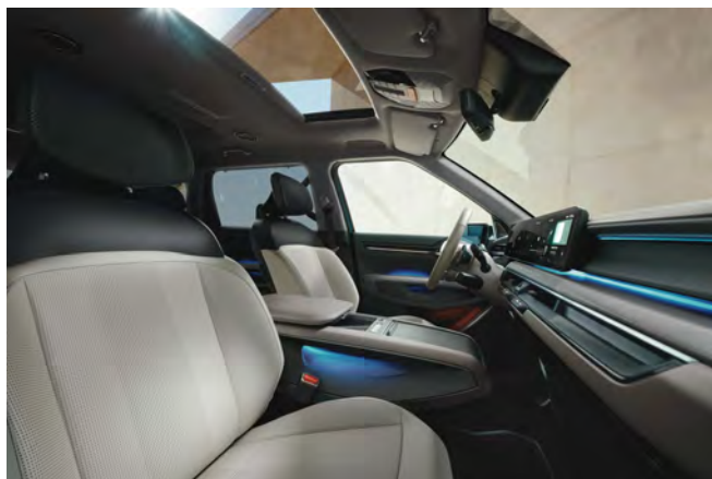
Světlý interiér (veganská kůže) - volitelně pro Earth