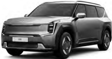
Šedá Pebble (DFG)