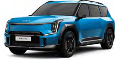
Modrá Ocean - lesklá (OBG) - dostupné pouze pro GT-Line