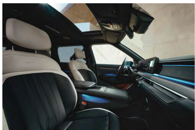
Tmavý interiér (veganská kůže) - standardně pro GT-Line