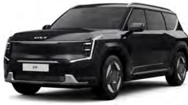
Perletová Černá Aurora (ABP)