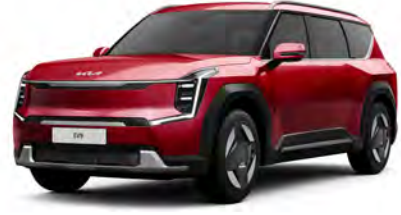
Červená Flare (C7R)