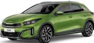
Zelená Celadon Spirit (CE6)