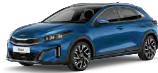
Modrá Flame (B3L)