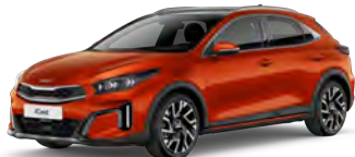
Oranžová Fusion (RNG) - není dostupná pro GT-Line