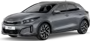
Stříbrná Lunar (CSS)