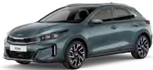
Šedá Yucca Steel (USG) - není dostupná pro GT-Line