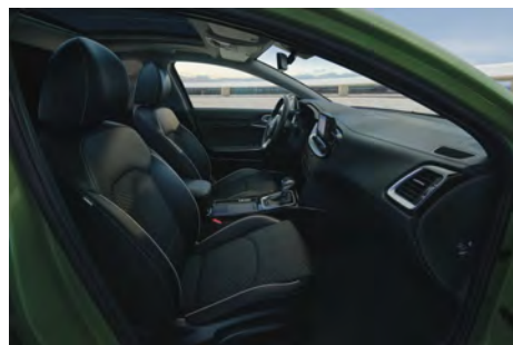
Čalounění v kombinaci látka/umělá kůže - standard pro Exclusive a TOP