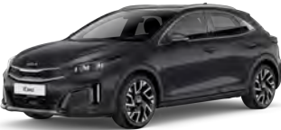
Šedá Penta Metal (H8G)