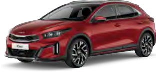
Červená Infra (AA9)