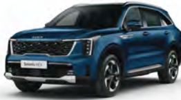
Modrá Mineral (M4B)