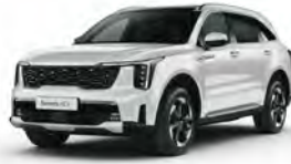
Perleťová Bílá Snow (SWP)