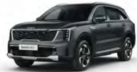
Šedá Interstellar (AGT)