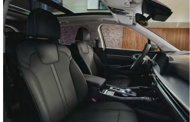
Standardní čalounění - pro Premium, TOP