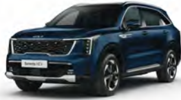
Modrá Gravity (B4U)