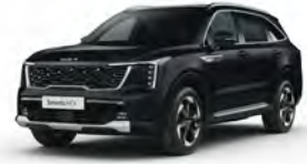
Perleťová Černá Aurora (ABP)