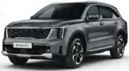
Šedá Steel (KLG)