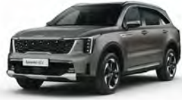
Hnědá Volcanic Sand (BN4)