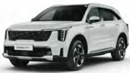
Bílá Clear (UD)