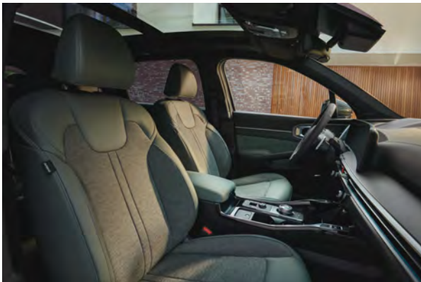
Standardní čalounění - pro Exclusive