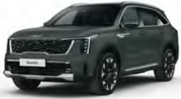
Zelená Cityscape (CGE)