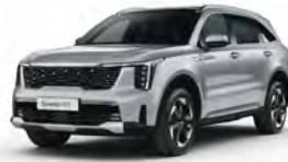
Stříbrná Silky (4SS)